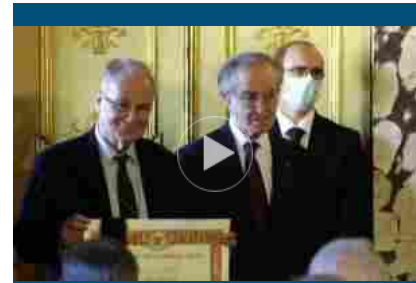
Ai Lincei conferiti Premi Balzan 2020 alla presenza di Mattarella