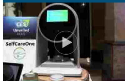
Oli essenziali fai da te e smart per il benessere a casa