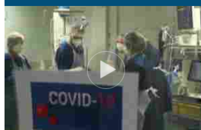
Covid, Gimbe: sale pressione sugli ospedali. Ritardo sui richiami