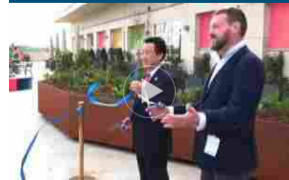
NaturaSì ha inaugurato un Bio-Orto innovativo sul tetto della Fao