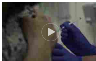
Covid, "l'immunità della doppia dose di Pfizer cala dopo 3 mesi"